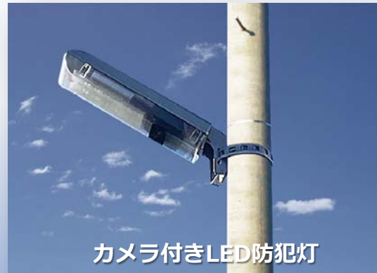
カメラ付きLED防犯灯