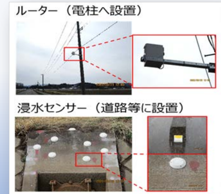
ルーター（電柱へ設置）