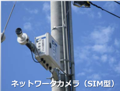
ネットワークカメラ（SIM型）